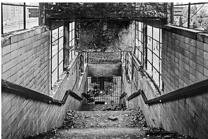
Berlin avant 1990 : une « geisterbahnhöfe » station de métro fantôme au-delà du mur

Ils invitent donc les membres du Conseil de développement à faire quelques pas pour observer le désastre. En souhaitant qu'un jour des édiles avisés sauront, à peu de frais mais avec un peu d'imagination pour la maintenance et la surveillance, faire revivre ce triste lieu moribond tout près pourtant des fastes et des lumières du centre-ville.