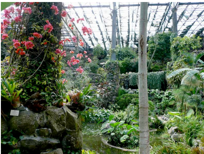
Lisbonne Estufia Fria

2 – A Lisbonne encore, Estufa Fria (un exemple cité dans le projet Jules Verne par Yves Laîné). Très beau site, bien aménagé dans une ancienne carrière, avec les deux parties ; protégée mais non fermée pour la partie Estufa Fria (serre froide) et sous forme de serres pour la partie Estufa Quente (serre chaude). Un lieu de repos zen et d'une belle diversité végétale. On imagine volontiers un projet de cette nature dans la carrière Miséry au Bas-Chantenay.