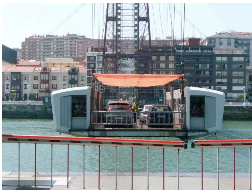
Pont de Biscaye – La nacelle