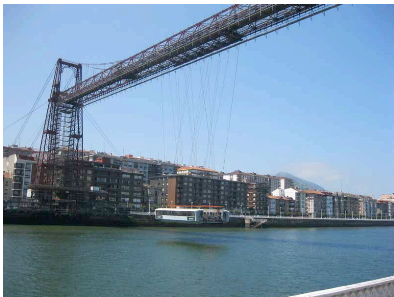
Bilbao - Pont de Biscaye

Quelques illustrations versées au dossier