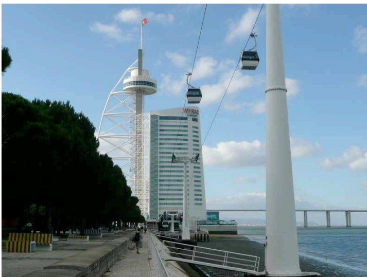
Lisbonne – télécabine Parc des Nations

Elles n'ont qu'un usage touristique. 1,5 km le long de l'estuaire du Tage et du Parc des Nations à Lisbonne réalisé en 1998 lors de l'Exposition universelle, à 30 mètres de hauteur. Contrairement à ce que je pensais, partir du niveau de l'eau, ne soulève pas de difficultés notables. Mais ça coûte cher : 4 € l'aller simple à Lisbonne, dans des cabines qui peuvent contenir 6 à 8 personnes. A Porto, le téléphérique est nettement plus court (560 mètres). Il survole les habitations et part d'un point haut jusqu'au bord du Douro (60 mètres de dénivelé). Il est donné pour transporter 850 personnes/heure. Le coût est de 5 € et 8 € l'AR.