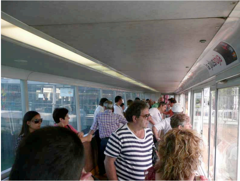
Pont de Biscaye – Compartiment piétons