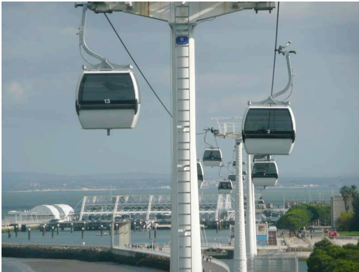
Lisbonne – télécabine Parc des Nations