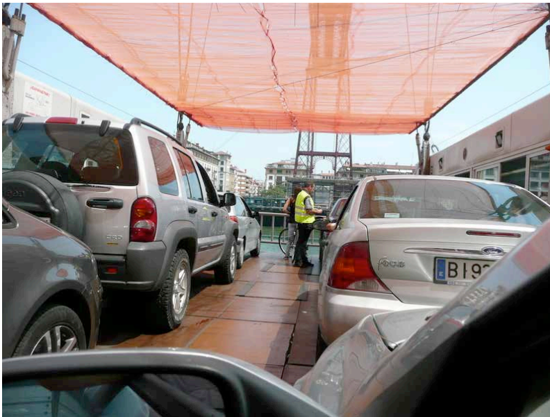
Pont de Biscaye – Partie centrale de la nacelle