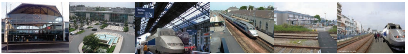
Gare de Massy